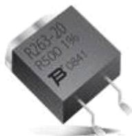
厚膜电阻器 - SMD