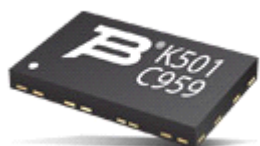
薄膜电阻器 - SMD