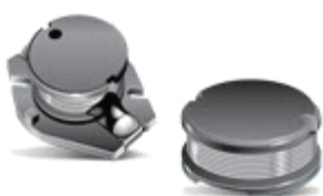
微调电阻器 - 表面贴装