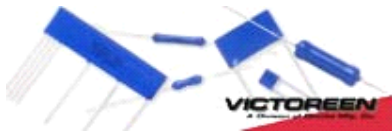
高压、厚膜、精密电阻